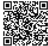
QR-Code Circle Illusion

Welche Assoziationen kommen dir in den Sinn?