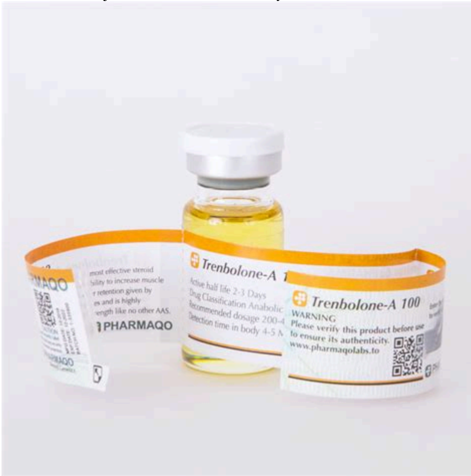
Lowtiyel Gel 50 mg Top 14

Ingredientes: Para 1 sobre : 2,5 g de gel dosificado al 2% de testosterona (aproximadamente 50 mg de testosterona por sobre) del mismo tipo que el producido en el cuerpo (hydroxyandrost-4-en-3-one), Alcohol denat, aqua, propylene glycol, DMDM hydantoin, carbomer, triethanolamine. La testosterona pertenece a una clase de hormonas conocidas como andrógenos; de hecho, es la principal hormona androgénica. Una hormona muy poderosa por sí misma, la testosterona es en gran medida responsable del desarrollo de los testículos y la próstata, así como del desarrollo del tejido muscular, la densidad y la fuerza de los huesos.